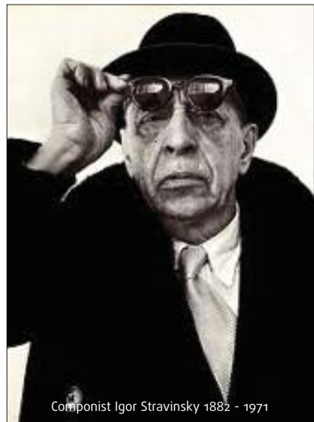
Componist Igor Stravinsky 1882 - 1971

Er zijn talloze uitvoeringen en interpretaties van dit beroemde ballet. Ook Dario Fo waagt zich aan dit ballet. Het centrale thema in de Sacre is het brengen van een offer. In onze uitvoering gaat het over de offers die een vrouw moet brengen. Over het verliezen van onbevangingheid en frisheid van de jeugd. Over de onzekerheid van de veranderingen naar volwassenheid. Over het verloren gaan van een jong krachtig lichaam. Over het verdragen van de onvoorstelbare kracht van het krijgen van een kind. Over het loslaten van je kinderen. Over verandering en verlies van vruchtbaarheid. Over het verdriet van verlies.