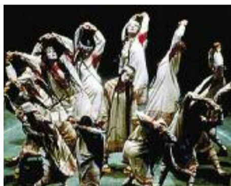
Uitvoering van Le Sacre van Joffrey Ballet's in 1987 in de originele setting, kostuums en choreografie uit 1913.