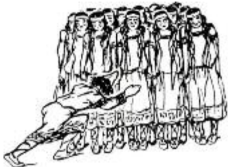
Illustratie van de eerste uitvoering van Stravinsky's Le Sacre du Printemps in 1913.

Een beroemd ballet. Een baanbrekend ballet. Een vernieuwend ballet. Een veelvuldig uitgevoerd ballet. Een ballet met een geschiedenis. Een ballet met toekomst. Een ballet over een offer brengen. Een ballet voor Dario Fo? Ja, met 100 vrouwen in de leeftijd van 7 tot 77 jaar.