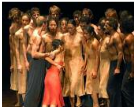
Le Sacre du Printemps in choreografie van Pina Bausch in 1975